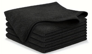
CHIFFONS MIRCOFILMS NOIRS