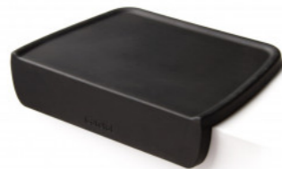
TAPIS DE TASSAGE