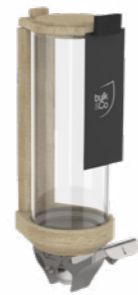
SILO BULK OU SILO TOPER