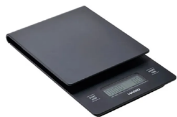
BALANCE CHRONOMÈTRE HARIO