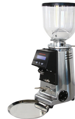
MST 64P EV