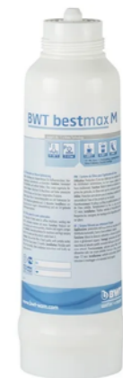
FILTRE BWT BESTMAX M, L, XL