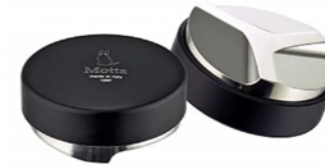
RÉPARTITEUR DE MOUTURE