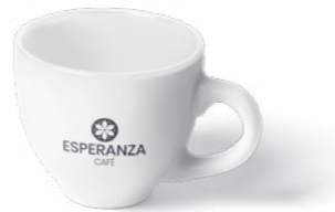
TASSE ESPRESSO OU CAPPUCCINO