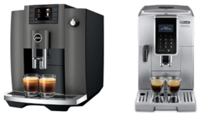
MACHINE À CAFÉ AUTOMATIQUE JURA OU DELONGHI