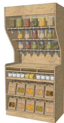
MEUBLE À SILO

ESPERANZA CAFÉ Tel. 01 81 93 69 79 Mail. info@esperanzacafe.com