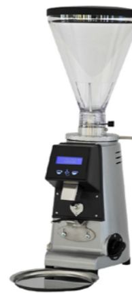
MST 64P E