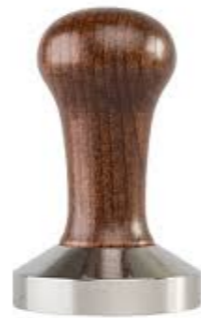
TASSEUR TAMPER 58 MM