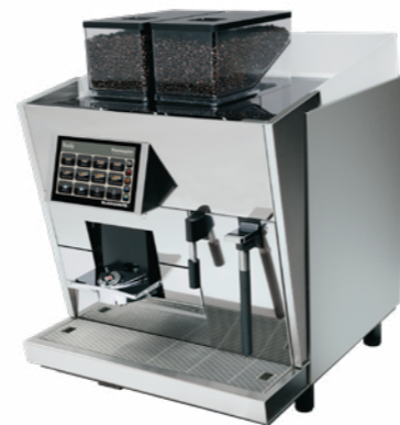
BW3 CTS 50 000 BOISSONS / AN BUSE VAPEUR EXTERNE PERMETTANT UNE DIVERSITÉ DE LAIT INFINIE.