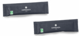
BOITE DE SUCRES BIO x100 sucre