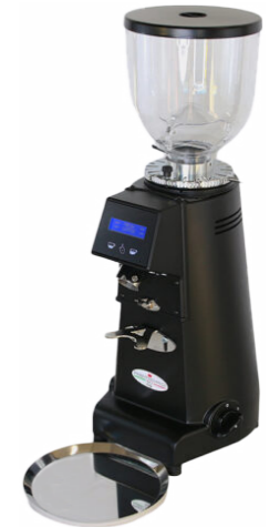
MST 83P E