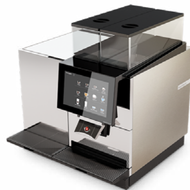
BW4 CTM RL 50 000 BOISSONS / AN DOUBLE SYSTÈME DE LAIT AVEC FRIGO INTÉGRÉ (2 LAIT POSSIBLE)