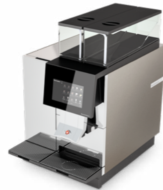
BW4c CTM RS 30 000 BOISSONS / AN SYSTÈME DE LAIT BREVETÉ AVEC FRIGO INTÉGRÉ (1 SEUL LAIT)