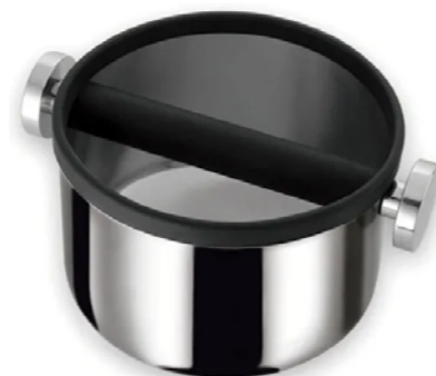
BAC À MARC CIRCULAIRE