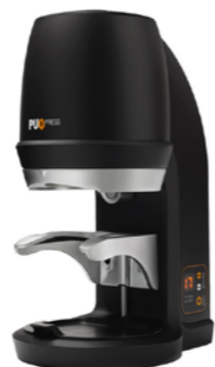
RÉPARTITEUR DE MOUTURE